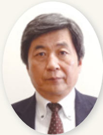
①野見山 勤 (保健福祉局長) ②福岡市